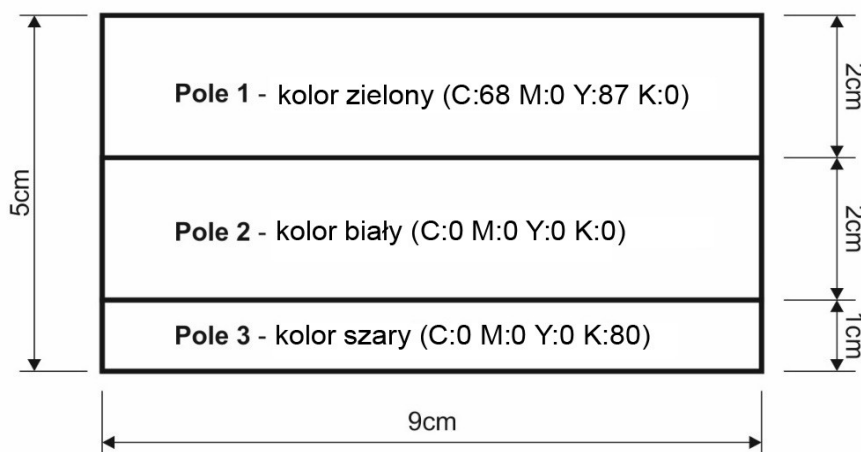
Rysunek 1. Awers

Pole 1: teksty: „Imię i nazwisko” (z miejscem na wpisanie imienia i nazwiska) oraz tekst „Termin ważności” (z miejscem na wpisanie terminu ważności karty).