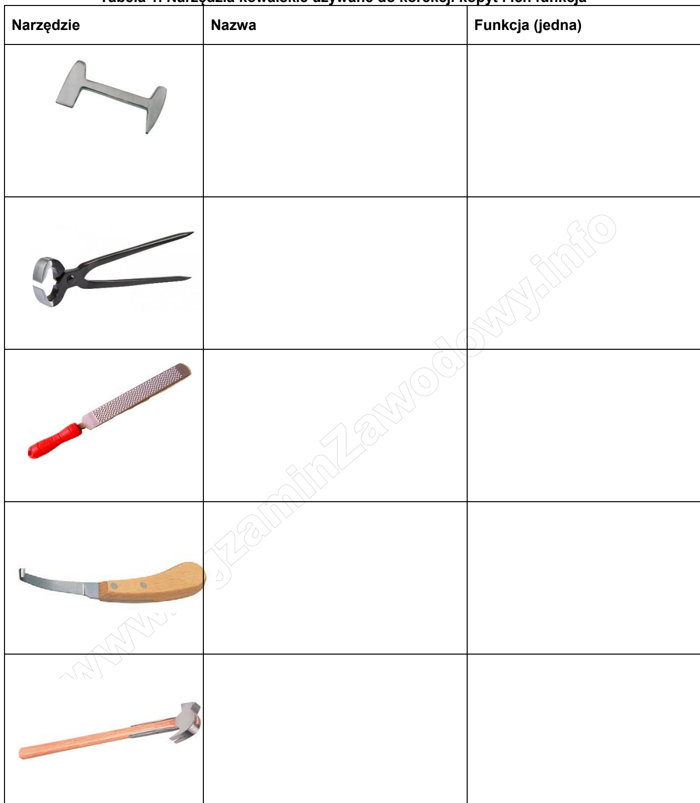
Tabela 1. Narzędzia kowalskie używane do korekcji kopyt i ich funkcja