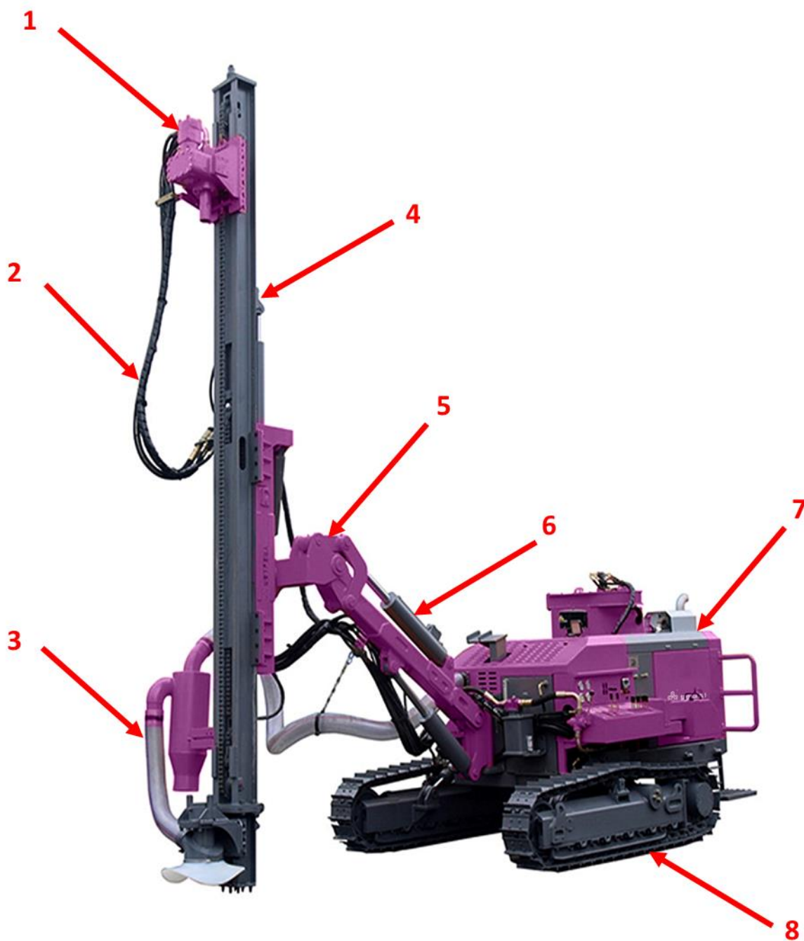
Rysunek 2. Wiertnica górnicza