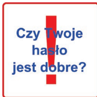
Rysunek 1. Grafika

Witryna internetowa wykorzystuje grafikę, którą należy przygotować. Jest ona zgodna z rysunkiem 1.