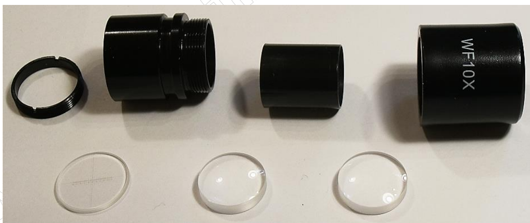
Rysunek 2. Zespół okularu mikroskopowego w rozbiorze na części.

Czas przeznaczony na wykonanie zadania wynosi 120 minut.