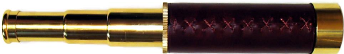
Ilustracja 1. Luneta kapitańska 12 x 30