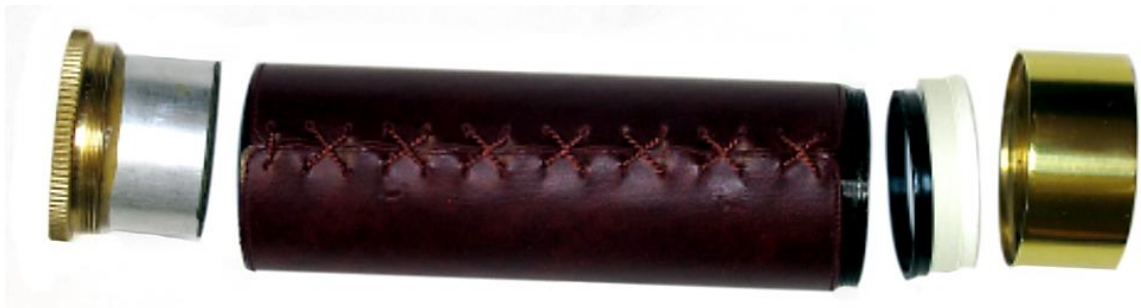
Ilustracja 2. Obiektyw lunety kapitańskiej 12 x 30 w rozbiorze na części