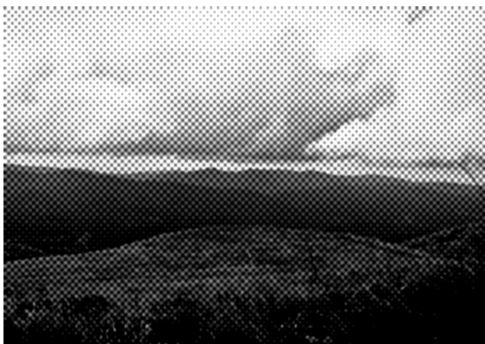
Zdjęcie po stylizacji