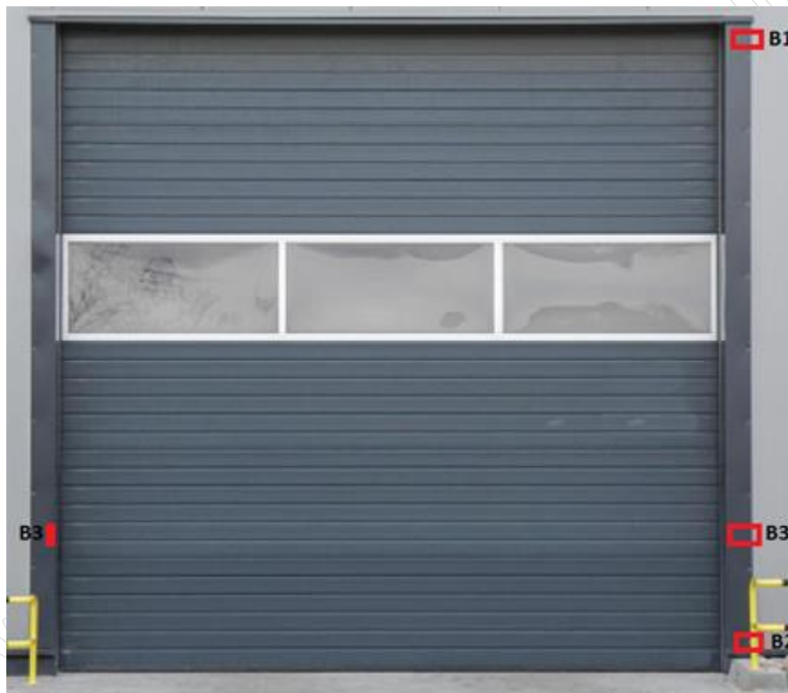
Rysunek 1. Brama przemysłowa z rozmieszczeniem czujników