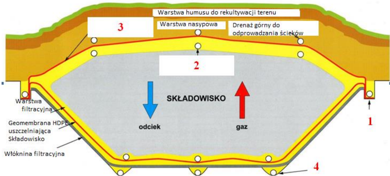
Przekrój składowiska odpadów

Rury do odbioru gazu ze składowiska oznaczone zostały na rysunku cyfrą