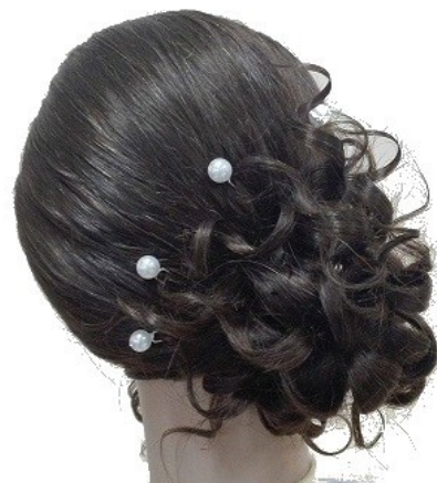
Widok – tył