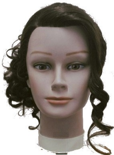
Widok – przód