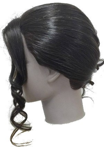
Widok – lewy bok