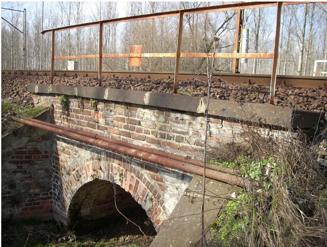
Ilustracja 1. Kolejowy obiekt inżynierski w km 108,650 linii kolejowej nr 273