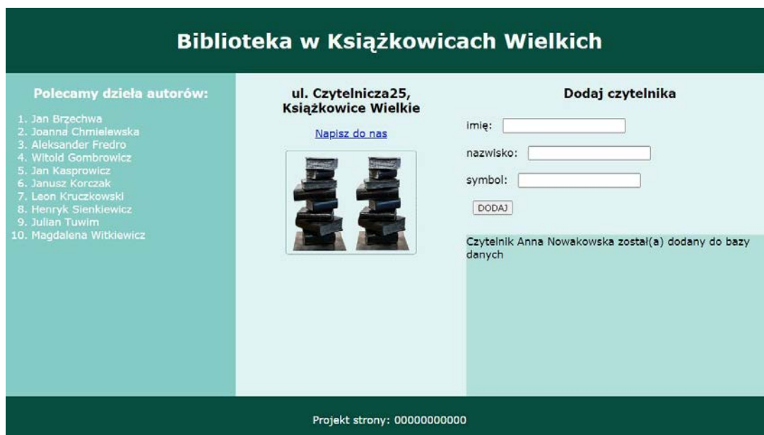
Obraz 2. Witryna internetowa. Po zatwierdzeniu danych z formularza