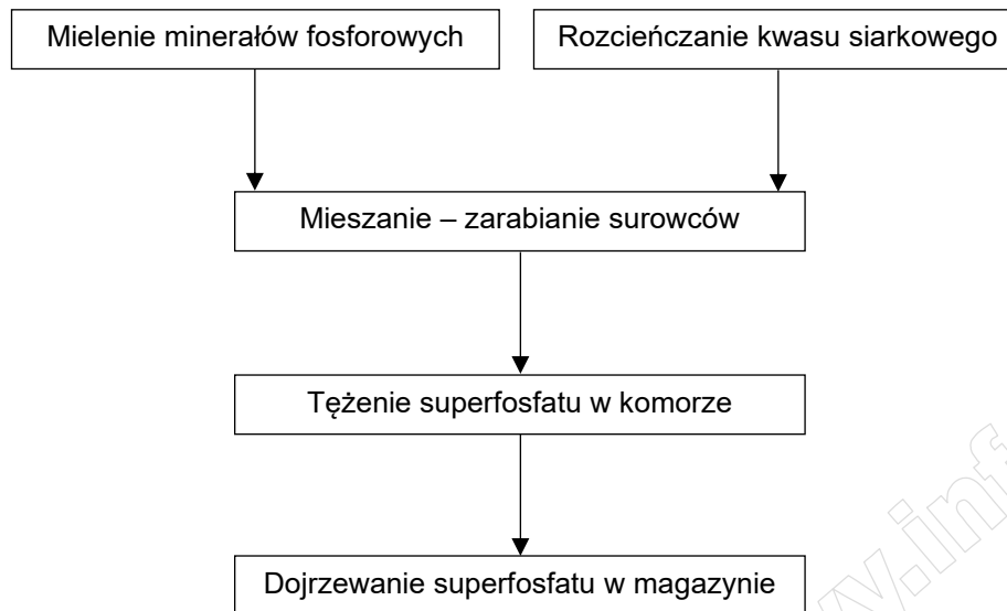
Rysunek 1. Schemat ideowy produkcji superfosfatu prostego