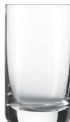
poj. 250 ml