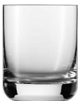
poj. 200 ml