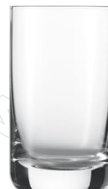
poj. 330 ml