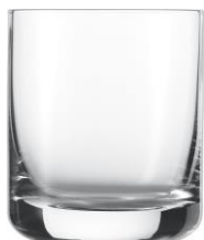
poj. 300 ml