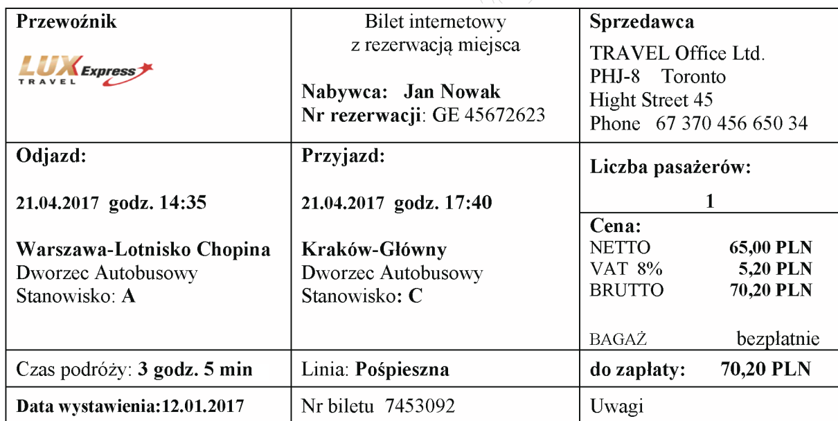
Tabela 3. Wydruk internetowej rezerwacji biletu autobusowego

Na trasie: Toronto-Warszawa różnica czasu 6 godzin