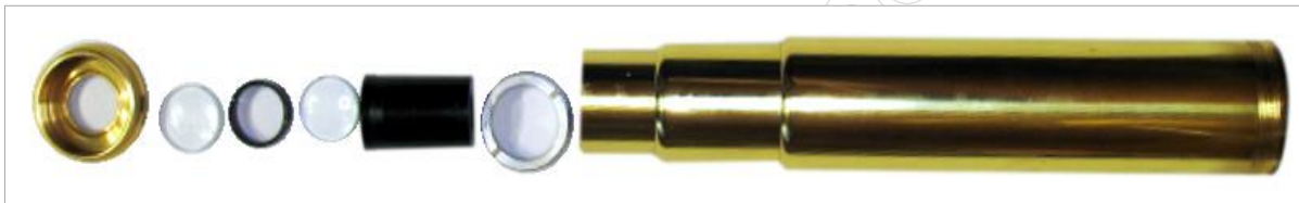
Rysunek 5. Okular lunety kapitańskiej 12 x 30 w rozbiorze na części

Czas przeznaczony na wykonanie zadania wynosi 120 minut.