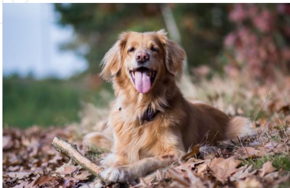
zdjęcie psa z pliku pies.jpg