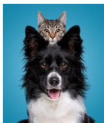
Koty i psy