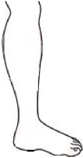
Tabela A. Karta miar