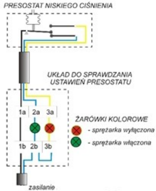
Rysunek 3. Schemat podłączenia układu do testowania presostatu.