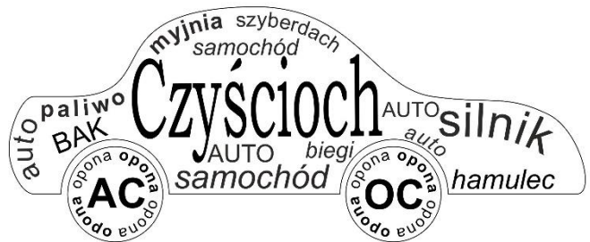
Rysunek 2. Przykładowy projekt grafiki

Uwaga: Wykonując grafikę należy wykonać własny projekt – nie można odwzorowywać grafiki przedstawionej jako przykład.