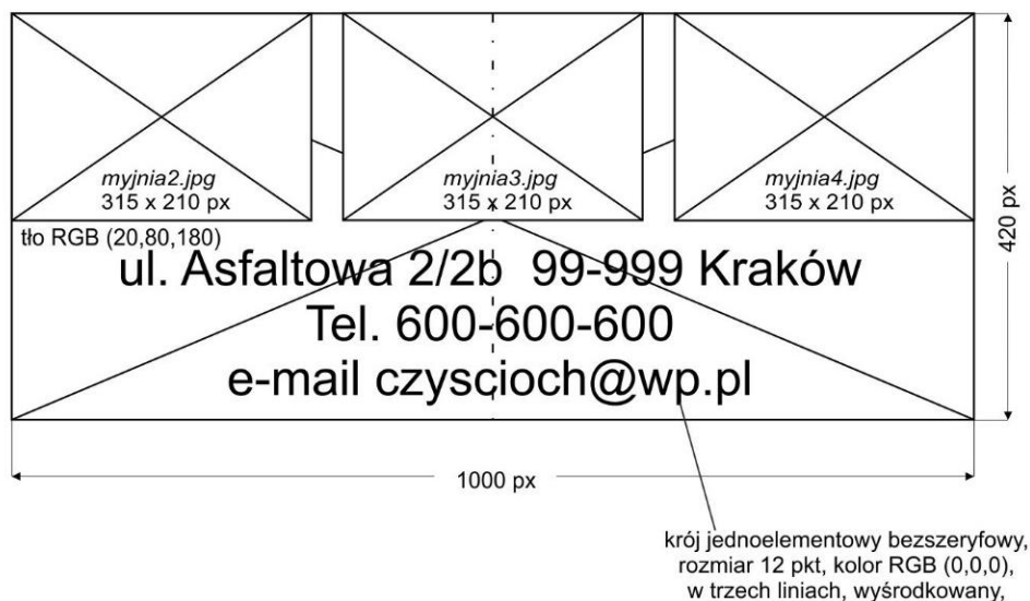
Rysunek 4. Makieta rozmieszczenia elementów – obraz statyczny 2