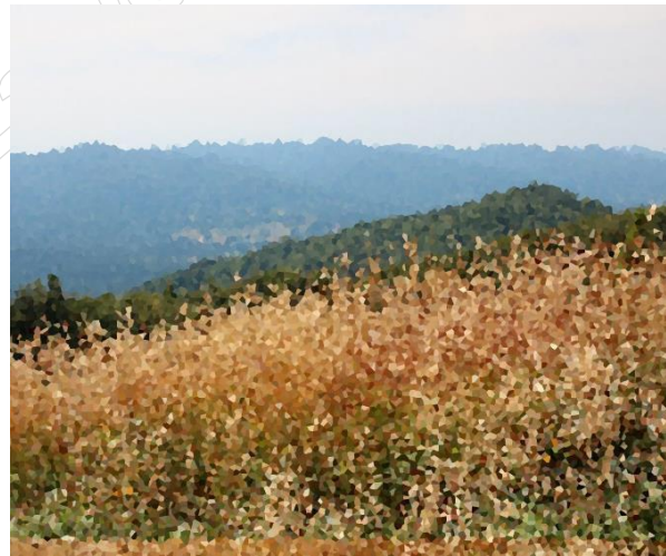
Obraz po zastosowaniu filtra