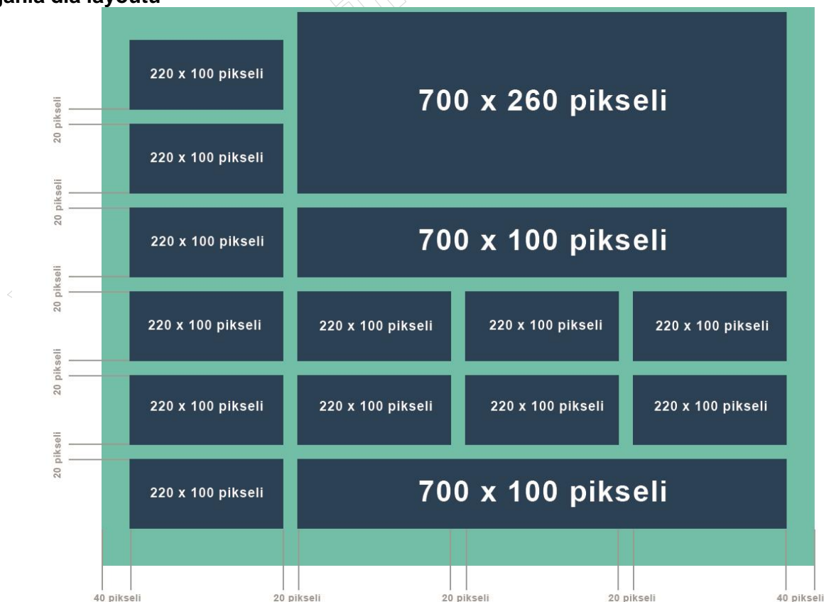
Rysunek 2. Schemat rozmieszczenia elementów layoutu