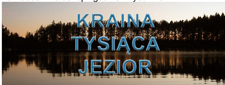
Rysunek 1. Wzór banera

projekt wykonaj w programie Adobe Photoshop zgodnie z rysunkiem: