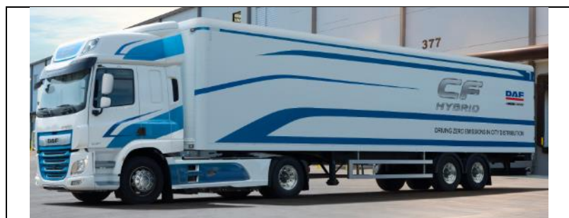
Odległość pomiędzy osiami naczepy 1,75m